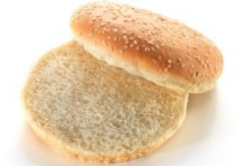
WITH SESAME SEEDS ΜΕ ΣΟΥΣΑΜΙ