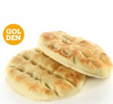
CORN FLOUR ΑΛΕΥΡΙ ΚΑΛΑΜΠΟΚΙΟΥ