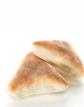
WHEAT FLOUR ΑΛΕΥΡΙ ΣΙΤΟΥ