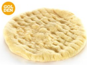
CORN FLOUR ΑΛΕΥΡΙ ΚΑΛΑΜΠΟΚΙΟΥ