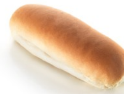
WHEAT FLOUR ΑΛΕΥΡΙ ΣΙΤΟΥ