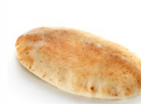
WHEAT FLOUR ΑΛΕΥΡΙ ΣΙΤΟΥ