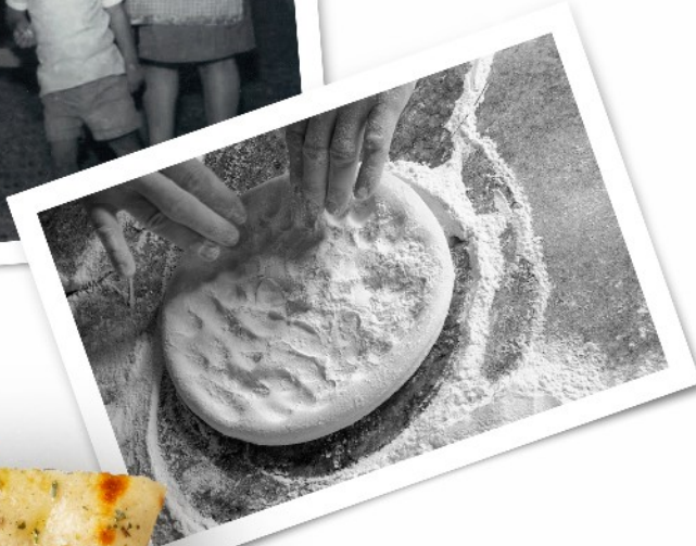
Ο παππούς, η γιαγιά & τα 3 αδέρφια Λεοντιάδη το 1968, στο παραδοσιακό εργαστήριο της οικογένειας.