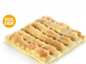
CORN FLOUR ΑΛΕΥΡΙ ΚΑΛΑΜΠΟΚΙΟΥ