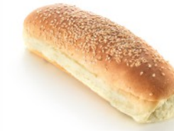
RUSTIC WITH SESAME SEEDS ΧΩΡΙΑΤΙΚΟ ΜΕ ΣΟΥΣΑΜΙ