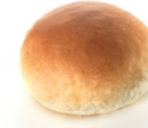
WHEAT FLOUR ΑΛΕΥΡΙ ΣΙΤΟΥ