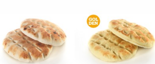
WHEAT FLOUR ΑΛΕΥΡΙ ΣΙΤΟΥ