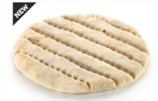
WHEAT FLOUR ΑΛΕΥΡΙ ΣΙΤΟΥ