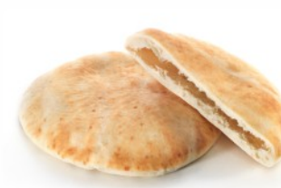
WHEAT FLOUR ΑΛΕΥΡΙ ΣΙΤΟΥ