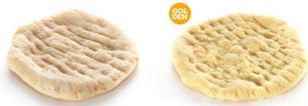
WHEAT FLOUR ΑΛΕΥΡΙ ΣΙΤΟΥ