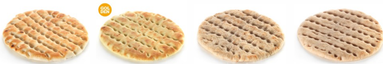
WHEAT FLOUR ΑΛΕΥΡΙ ΣΙΤΟΥ